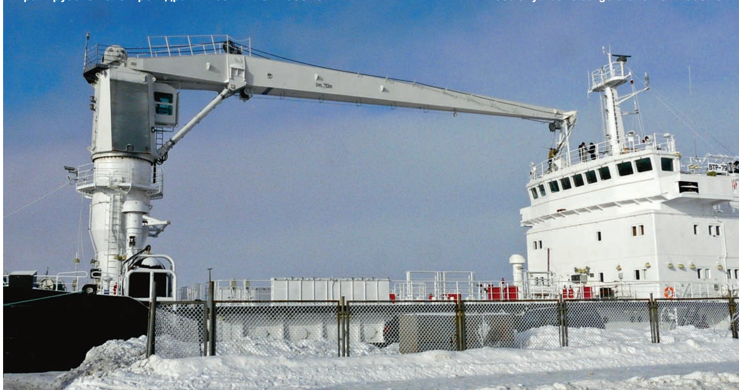
Electrohydraulic cargo crane КЭГ 20031С