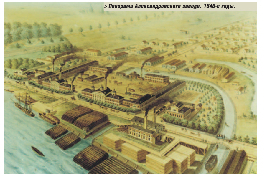
Панорама Александровского завода. 1840-е годы.

Учрежденный в 1826 г. в Санкт-Петербурге Александровский завод (ныне – ОАО «Пролетарский завод») приобрел славу «живителя российских мануфактур». Этот высокий статус был заслуженным. В мастерских предприятия изготавливались паровые машины, плющильные, сверлильные и другие обрабатывающие станки. При нем действовала и судовой верфь, на которой строились первые в стране пароходы. Впрочем, слово «первые» применимо ко многим образцам продукции предприятия. Именно в пехах Александровского завода, например,