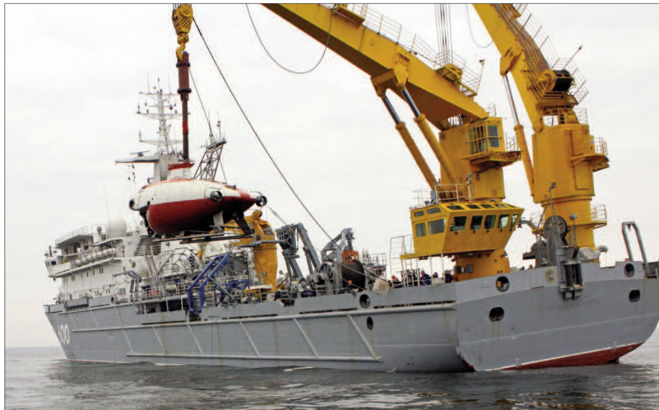
> Спасательное буксирное судно с помощью грузового электрогидравлического крана КЭГ 80019С производства «Пролетарского завода» спускает на воду уникальный глубоководный аппарат «Консул», снабженный манипуляторным устройством, сделанном на «Пролетарском заводе».

Редакция журнала «Национальная оборона» поздравляет коллектив ОАО «Пролетарский завод» с юбилеем и желает новых трудовых свершений на благо Родины и флота!