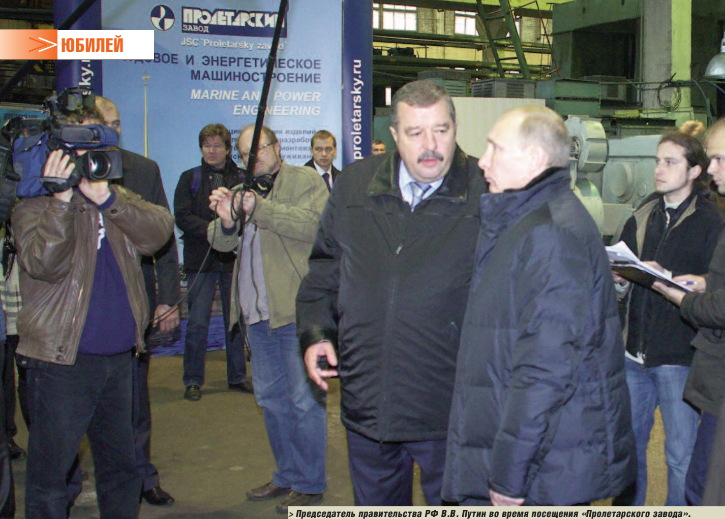
Председатель правительства РФ В.В. Путин во время посещения «Пролетарского завода».